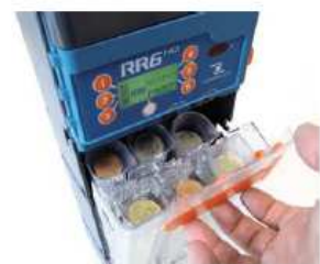
6 Tubos con capacidad para 400 monedas